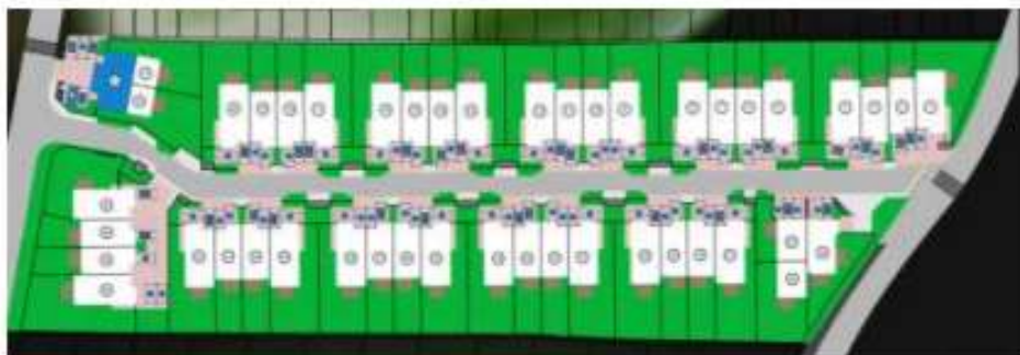
obr. 2 a 3